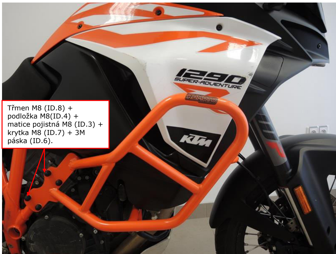
Třmen M8 (ID.8) + podložka M8(ID.4) + matice pojistná M8 (ID.3) + krytka M8 (ID.7) + 3M páska (ID.6).