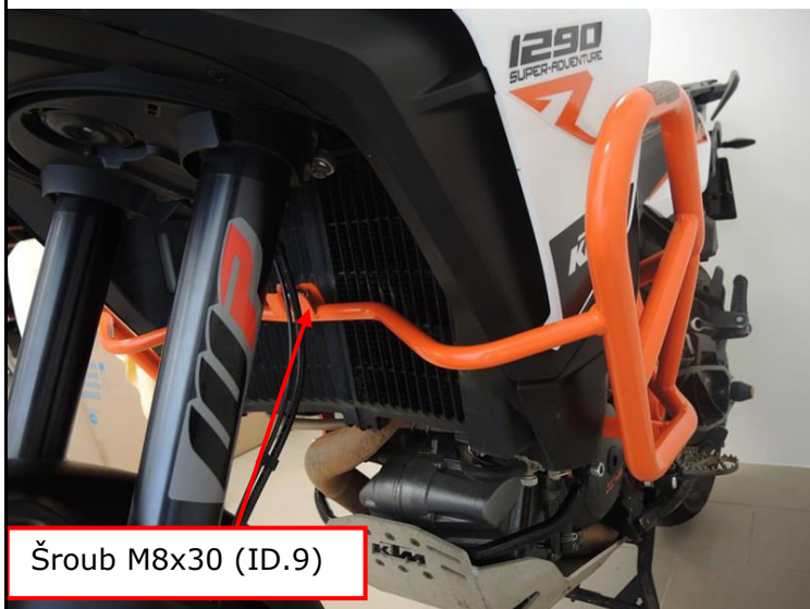
Šroub M8x30 (ID.9)